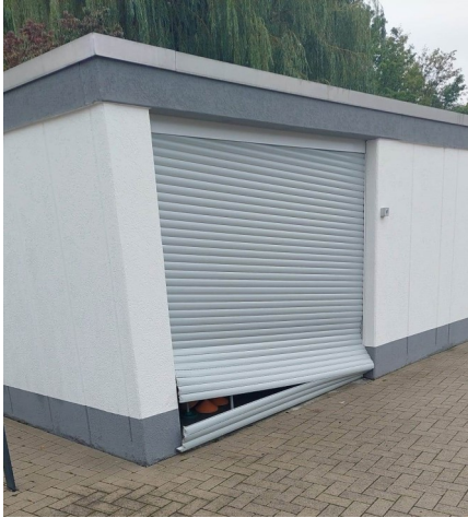
Einbruch in unserer Garage