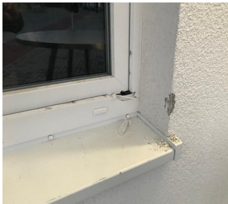
Einbruchsspuren am Fenster des Sozialraums