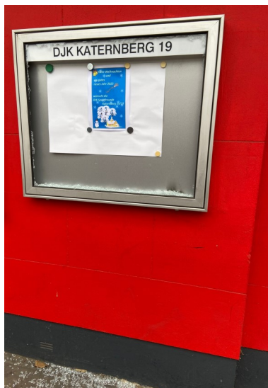
Eine zerstörte Scheibe an unserem Aushang