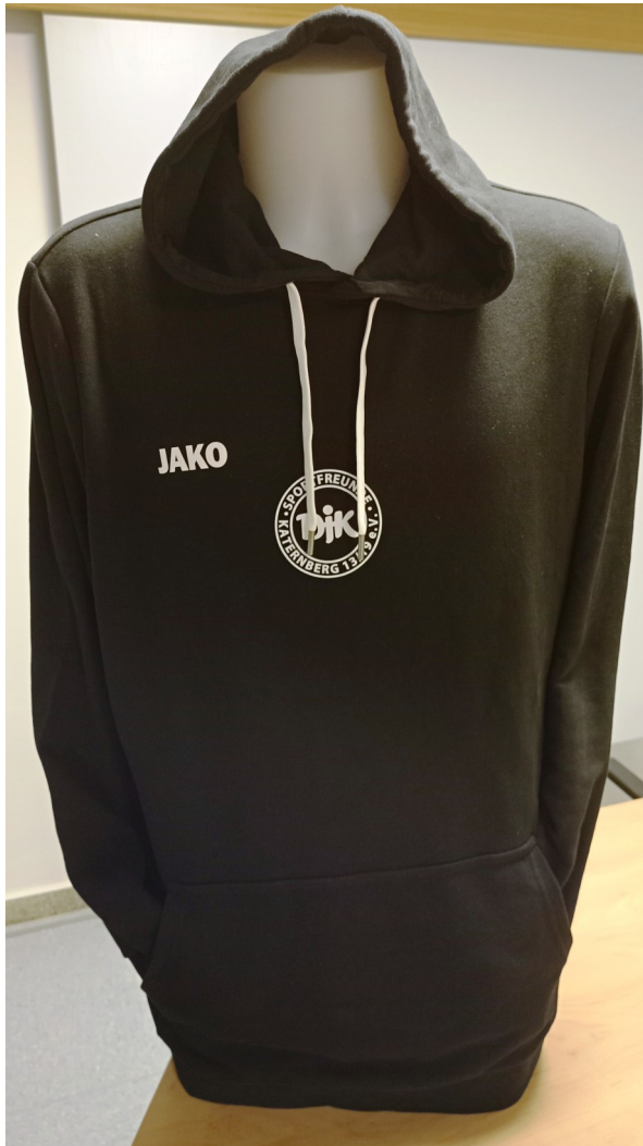
Kapuzensweat 40,00 Euro