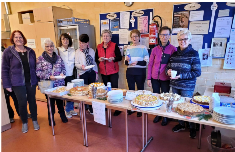
Die Damen der Cafeteria