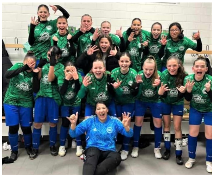
Die U17-Mannschaft nach dem Halbfinalsieg gegen den ETB

und wir dürfen uns auf spannende Endspiele um den Kreispokal freuen.